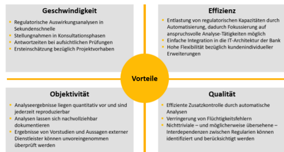
Abbildung 5: Vorteile des RFC Regulyzers

Die Einführung von RFC Regulyzer erlaubt die zügige Einführung einer effizienten, kostengünstigen RegTech-Lösung. Ein maßgeschneiderter Ausbau des Tools nach Ihren Wünschen und Vorgaben ist jederzeit möglich und erfolgt gemeinsam mit Ihnen und nach Ihren Bedürfnissen.